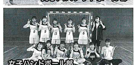
女子ハンドボール部