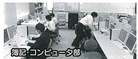
簿記・コンピュータ部