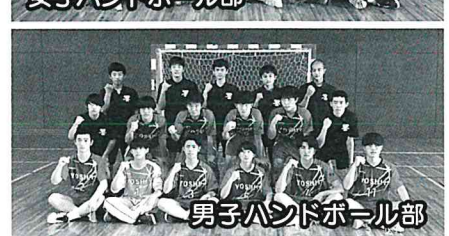
男子ハンドボール部